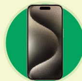
IPHONE 15 PRO 256GB