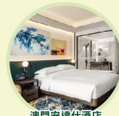
澳門安達仕酒店 標準客房住宿一晚連二人早餐 ONE-NIGHT STAY IN ANDAZ MACAO STANDARD ROOM WITH BREAKFAST FOR 2 PERSONS

*獎品數量有限，抽完即止 *GIFTS ARE LIMITED AND AVAILABLE WHILE STOCK LASTS